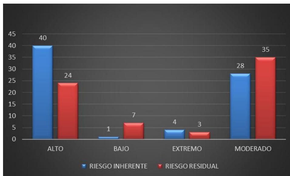
Gráfico 2. Zona de Riesgo Inherente y Residual

Se observa un comportamiento positivo en la valoración del riesgo, ubicados en los diferentes niveles de la zona de riesgos, toda vez que la utilización de los controles es con el objetivo de minimizar la probabilidad de ocurrencia del riesgo.